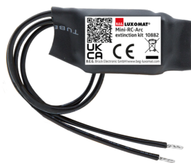
Mini RC-filter Art.nr.: 10882

Spanning: 230 V AC ±10% Afmetingen: 38 x 12 x 26 mm Beschermingsgraad/-klasse: IP20 / Klasse II