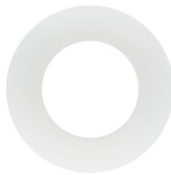
Afdekring PD9 Ø 36 mm Art.nr.: 92238

Afmetingen: Ø 36 mm Behuizing: polycarbonaat, UV- bestendig Kleur: antraciet glanzend