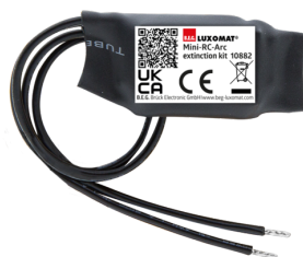
Mini RC-filter Art.nr.: 10882

Spanning: 230 V AC ±10% Afmetingen: 38 x 12 x 26 mm Beschermsgraad/-klasse: IP20 / Klasse II