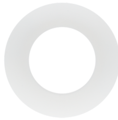
Afdekring PD9 Ø 36 mm Art.nr.: 92238

Afmetingen: Ø 36 mm Behuizing: polycarbonaat, UV- bestendig Kleur: antraciet glanzend