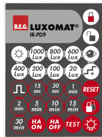
IR-PD9 Art.nr.: 92201

Afmetingen: 40 x 55 x 103 mm Kleur: zwart Frequentie: 2.4 GHz ISM band, GFSK 0.2 dBm + 5.3 dBi = 5.5 dBm