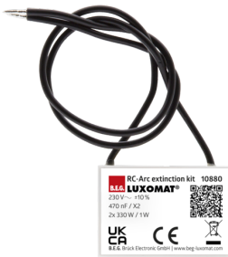
RC-filter Art.nr.: 10880

Afmetingen: 57 x 35 x 7 mm Kleur: - Accu: Lithium 3.0 V <BR>0 mAh