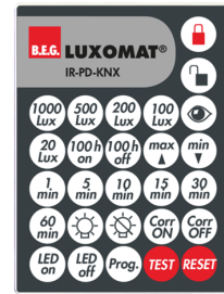
IR-PD-KNX Art.nr.: 92123

Afmetingen: 47 x 19 x 10 mm Beschermingsgraad/-klasse: IP20 Omgevingstemperatuur: -20 °C tot +40 °C