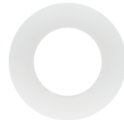
Afdekring PD9 Ø 36 mm Art.nr.: 92238

Afmetingen: Ø 36 mm Behuizing: polycarbonaat, UV- bestendig Kleur: antraciet glanzend