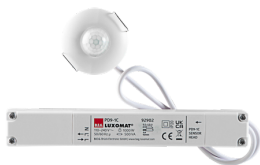
PD9-1C-IB Art.nr.: 92902

Om de bundel volgens de technische specificatie te ontvangen, bestelt u de genoemde items.