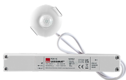
PD9-1C-IB Art.nr.: 92902

Om de bundel volgens de technische specificatie te ontvangen, bestelt u de genoemde items.