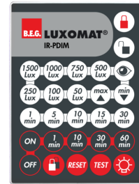
IR-PDIM Art.nr.: 92200

Afmetingen: 47 x 19 x 10 mm Beschermingsgraad/-klasse: IP20 Omgevingstemperatuur: -20 °C tot +40 °C