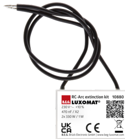
RC-filter Art.nr.: 10880

Afmetingen: 57 x 35 x 7 mm Kleur: - Accu: Lithium 3.0 V <BR>0 mAh