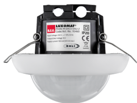
PD4N-M-DACO DALI-2 Art.nr.: 93460

Om de bundel volgens de technische specificatie te ontvangen, bestelt u de genoemde items.