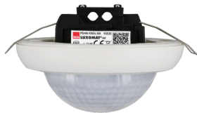
PD4N-KNXs-BA-IB Art.nr.: 93535

Om de bundel volgens de technische specificatie te ontvangen, bestelt u de genoemde items.