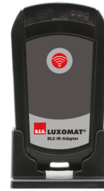
BLE-IR-Adapter Art.nr.: 93067

Spanning: 230 V AC \pm 10\% Afmetingen: 50 x 23 x 8 mm Beschermingsgraad/-klasse: IP20 / Klasse II