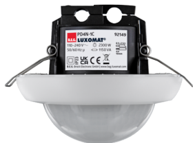
PD4N-1C-IB Art.nr.: 92149

Om de bundel volgens de technische specificatie te ontvangen, bestelt u de genoemde items.