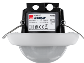
PD4N-1C-IB Art.nr.: 92149

Om de bundel volgens de technische specificatie te ontvangen, bestelt u de genoemde items.