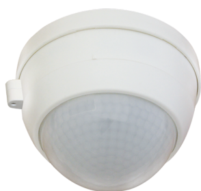
PD4-S-DAA4G-OB Art.nr.: 92759

Om de bundel volgens de technische specificatie te ontvangen, bestelt u de genoemde items.