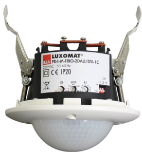
PD4-M-TRIO-2DALI/DSI-1C-IB Art.nr.: 92756

Om de bundel volgens de technische specificatie te ontvangen, bestelt u de genoemde items.