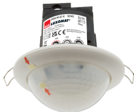
PD4-M-2C-C-IB Art.nr.: 92143

Om de bundel volgens de technische specificatie te ontvangen, bestelt u de genoemde items.