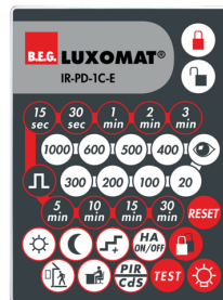
IR-PD-1C-E Art.nr.: 92077

Afmetingen: 80 x 60 x 8 mm Kleur: - Accu: Lithium 3.0 V <BR>0 mAh