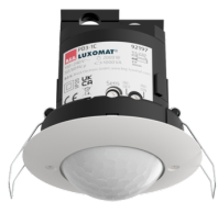
PD3-1C-IB Art.nr.: 92197

Om de bundel volgens de technische specificatie te ontvangen, bestelt u de genoemde items.