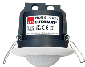
PD2N-S Art.nr.: 93240

Om de bundel volgens de technische specificatie te ontvangen, bestelt u de genoemde items.