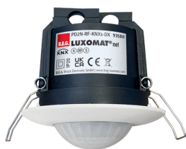
PD2N-RF-KNXs-DX-IB Art.nr.: 93580

Om de bundel volgens de technische specificatie te ontvangen, bestelt u de genoemde items.