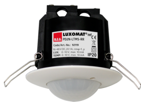
PD2N-LTMS-RR-IB Art.nr.: 92119

Om de bundel volgens de technische specificatie te ontvangen, bestelt u de genoemde items.