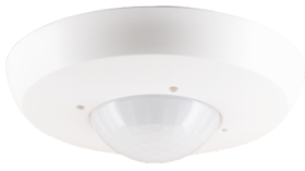
PD2N-KNXs-OCCULOG-DX-VZ Art.nr.: 93531

Om de bundel volgens de technische specificatie te ontvangen, bestelt u de genoemde items.