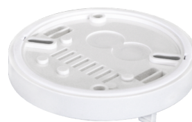
OB sokkel IP54 voor PD2- / PD4-OB Art.nr.: 92161

Afmetingen: Ø 200 x 90 mm Slagvastheid: IK09 Behuizing: gecoate stalen korf