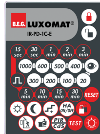
IR-PD-1C-E Art.nr.: 92077

Afmetingen: 80 x 60 x 8 mm Kleur: - Accu: Lithium 3.0 V > 0 mAh