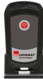
BLE-IR-Adapter Art.nr.: 93067

Spanning: 230 V AC \pm 10\% Afmetingen: 50 x 23 x 8 mm Beschermsgraad/-klasse: IP20 / Klasse II