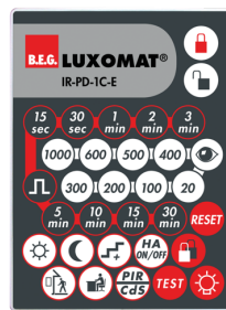
IR-PD-1C-E Art.nr.: 92077

Afmetingen: 80 x 60 x 8 mm Kleur: - Accu: Lithium 3.0 V <BR>0 mAh