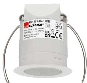
PD11-M-1C-FLAT-IB Art.nr.: 92583

Om de bundel volgens de technische specificatie te ontvangen, bestelt u de genoemde items.