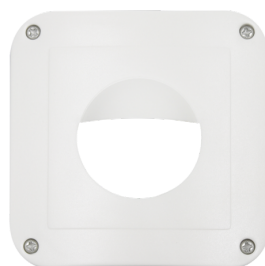
Centrale afdekplaat IP54 Indoor 180 Art.nr.: 92139

Spanning: via de KNX bus Afmetingen: (zonder afdekraam) 70 x 70 x 61 mm Stroomverbruik: 12 mA