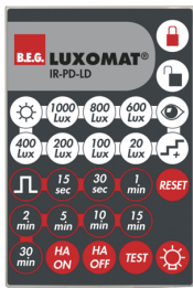
IR-PD-LD Art.nr.: 92479

Afmetingen: 40 x 55 x 103 mm Kleur: zwart Frequentie: 2.4 GHz ISM band, GFSK 0.2 dBm + 5.3 dBi = 5.5 dBm