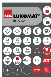
IR-RC-LD Numero: 92649

Batteria: 3.0 V Llitio CR2032 (incluso) Dimensioni: 80 x 60 x 8 mm Colore di materiale: -