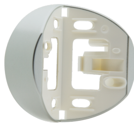
Attacco angolare RC-plus next Numero: 97043

Dimensioni: Ø 164 x 143 mm Resistenza agli urti: IK09 Involucro: Cestello di protezione