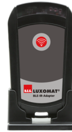
BLE-IR-Adapter Numero: 93067

Alimentazione: 230 V AC ±10% Dimensioni: 50 x 23 x 8 mm Classe / Grado protezione: IP20 / Classe II