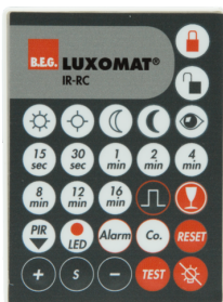
IR-RC Numero: 92000

Dimensioni: 40 x 55 x 103 mm Colore di materiale: nero Frequenza: 2.4 GHz Banda ISM, GFSK 0.2 dBm + 5.3 dBi = 5.5 dBm