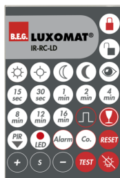
IR-RC-LD Numero: 92649

Batteria: 3.0 V Llitio CR2032 (incluso) Dimensioni: 80 x 60 x 8 mm Colore di materiale: -