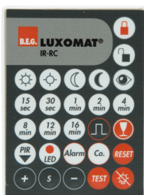
IR-RC Numero: 92000

Dimensioni: 40 x 55 x 103 mm Colore di materiale: nero Frequenza: 2.4 GHz Banda ISM, GFSK 0.2 dBm + 5.3 dBi = 5.5 dBm