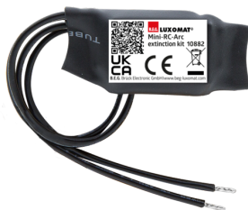
Mini-Filtro antidisturbo RC Numero: 10882

Alimentazione: 230 V AC \pm 10\% Dimensioni: 38 x 12 x 26 mm Classe / Grado protezione: IP20 / Classe II