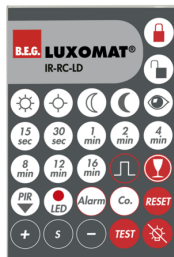
IR-RC-LD Numero: 92649

Batteria: 3.0 V Llitio CR2032 (incluso) Dimensioni: 80 x 60 x 8 mm Colore di materiale: -