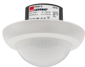
PD4N-1C-UP Numero: 92151

Per ottenere il set conforme alle specifiche tecniche, ordinare gli articoli elencati.