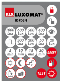
IR-PD3N Numero: 92105

Dimensioni: 40 x 55 x 103 mm Colore di materiale: nero Frequenza: 2.4 GHz Banda ISM, GFSK 0.2 dBm + 5.3 dBi = 5.5 dBm