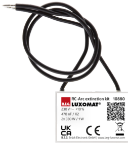
Filtro antidisturbo RC Numero: 10880

Alimentazione: 230 V AC ±10% Dimensioni: 38 x 12 x 26 mm Classe / Grado protezione: IP20 / Classe II