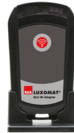
BLE-IR-Adapter Numero: 93067

Alimentazione: 230 V AC ±10% Dimensioni: 50 x 23 x 8 mm Classe / Grado protezione: IP20 / Classe II