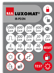
IR-PD3N Numero: 92105

Batteria: 3.0 V Llitio CR2032 (incluso) Dimensioni: 80 x 60 x 8 mm Colore di materiale: -