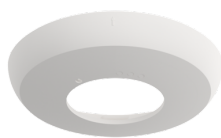
Anello PD2N UP Numero: 93760

Alimentazione: 230 V AC \pm 10\% 50 / 60 Hz Dimensioni: \varnothing 83 \times 81 mm Potenza assorbita: 1 W