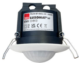
PD2N-RF-KNXs-DX-DE Numero: 93580

Per ottenere il set conforme alle specifiche tecniche, ordinare gli articoli elencati.