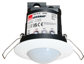
PD2-M-2C-DE Numero: 92165

Per ottenere il set conforme alle specifiche tecniche, ordinare gli articoli elencati.