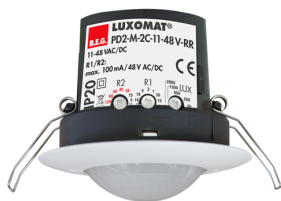
PD2-M-2C-12-48V-RR-DE Numero: 92306

Per ottenere il set conforme alle specifiche tecniche, ordinare gli articoli elencati.