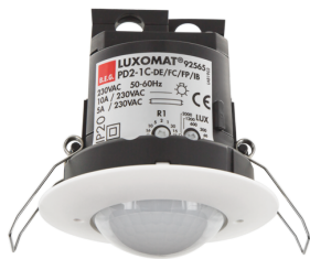
PD2-M-1C-DE Numero: 92565

Per ottenere il set conforme alle specifiche tecniche, ordinare gli articoli elencati.