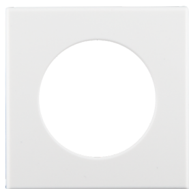
Anello di finitura quadrato PD11-DE Numero: 92994

Alimentazione: da KNX-BUS Dimensioni: Ø 52 x 48 mm Assorbimento: 12 mA