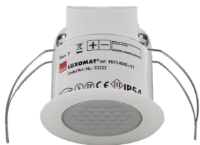
PD11-KNXs-FLAT-ST-DE Numero: 93522

Per ottenere il set conforme alle specifiche tecniche, ordinare gli articoli elencati.