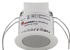
PD11-KNXs-FLAT-DX-DE Numero: 93523

Per ottenere il set conforme alle specifiche tecniche, ordinare gli articoli elencati.