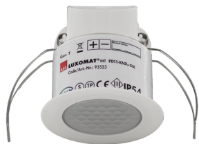
PD11-KNXs-FLAT-DX-DE Numero: 93523

Per ottenere il set conforme alle specifiche tecniche, ordinare gli articoli elencati.