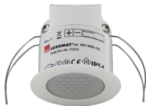
PD11-KNXs-FLAT-DX-DE Numero: 93523

Per ottenere il set conforme alle specifiche tecniche, ordinare gli articoli elencati.