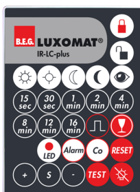
IR-LC-plus Numero: 92095

Dimensioni: 40 x 55 x 103 mm Colore di materiale: nero Frequenza: 2.4 GHz Banda ISM, GFSK 0.2 dBm + 5.3 dBi = 5.5 dBm