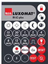
IR-LC-plus Numero: 92095

Dimensioni: 40 x 55 x 103 mm Colore di materiale: nero Frequenza: 2.4 GHz Banda ISM, GFSK 0.2 dBm + 5.3 dBi = 5.5 dBm