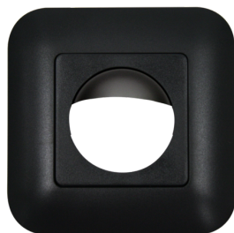
Copertura IP20 Indoor 180 Numero: 92634

Alimentazione: 110 - 240 V AC 50 / 60 Hz Dimensioni: Copertura inclusa 87 x 87 x 61 mm Potenza assorbita: ca. 0.4 W