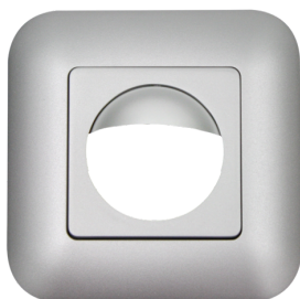
Copertura IP20 Indoor 180 Numero: 92633

Alimentazione: 110 - 240 V AC 50 / 60 Hz Dimensioni: Copertura inclusa 87 x 87 x 61 mm Potenza assorbita: ca. 0.4 W