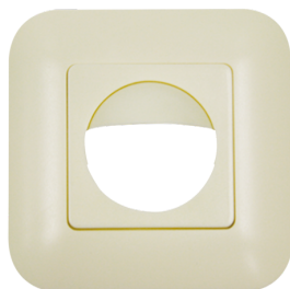
Copertura IP20 Indoor 180 Numero: 92632

Alimentazione: 110 - 240 V AC 50 / 60 Hz Dimensioni: Copertura inclusa 87 x 87 x 61 mm Potenza assorbita: ca. 0.4 W