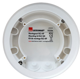
Set di montaggio BL2-AP Numero: 93256

Alimentazione: 110 - 240 V Dimensioni: Ø 80 x 61 mm Potenza assorbita: 0.3 W