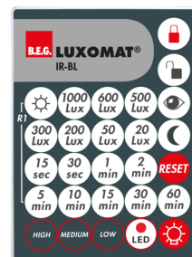
IR-BL Numero: 93055

Alimentazione: 230 V AC \pm 10\% Dimensioni: 50 x 23 x 8 mm Classe / Grado protezione: IP20 / Classe II