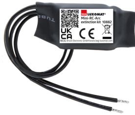
Mini-Filtro antidisturbo RC Numero: 10882

Alimentazione: 230 V AC \pm 10\% Dimensioni: 38 x 12 x 26 mm Classe / Grado protezione: IP20 / Classe II