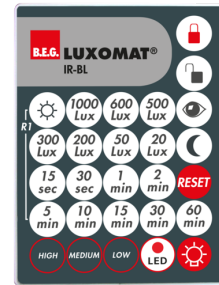
IR-BL Numero: 93055

Alimentazione: 230 V AC \pm 10\% Dimensioni: 50 x 23 x 8 mm Classe / Grado protezione: IP20 / Classe II