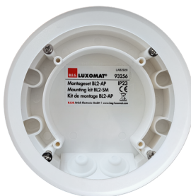
Set di montaggio BL2-AP Numero: 93256

Dimensioni: 40 x 55 x 103 mm Colore di materiale: nero Frequenza: 2.4 GHz Banda ISM, GFSK 0.2 dBm + 5.3 dBi = 5.5 dBm