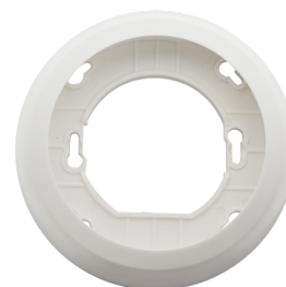
Set di montaggio BL2-UP Numero: 93251

Dimensioni: \varnothing 109 x 50 mm Classe / Grado protezione: IP23 Colore di materiale: bianco