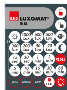
IR-BL Numero: 93055

Alimentazione: 230 V AC \pm 10\% Dimensioni: 50 x 23 x 8 mm Classe / Grado protezione: IP20 / Classe II