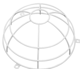
Griglia protezione BSK ( \varnothing 200 x 90 mm) Numero: 92199

Dimensioni: \varnothing 104 x 19 mm Colore di materiale: bianco