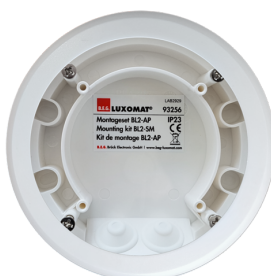
Set di montaggio BL2-AP Numero: 93256

Dimensioni: 40 x 55 x 103 mm Colore di materiale: nero Frequenza: 2.4 GHz Banda ISM, GFSK 0.2 dBm + 5.3 dBi = 5.5 dBm