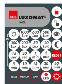
IR-BL Numero: 93055

Alimentazione: 230 V AC \pm 10\% Dimensioni: 50 x 23 x 8 mm Classe / Grado protezione: IP20 / Classe II