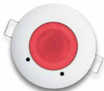
Aerazione richiesta urgentemente