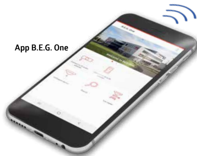
App B.E.G. One