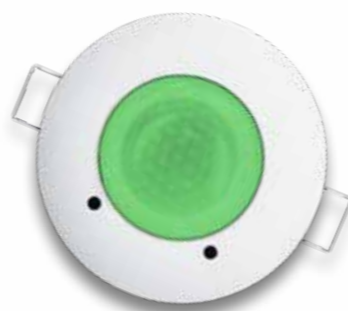
Buona qualità dell'aria

Questo dispositivo permette di segnalare il superamento delle soglie limite con un segnale acustico o con un contatto a relè.