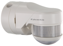
RC-plus next N 230 KNXs-DX Cikkszám: 93527

A csomag műszaki specifikációnak megfelelő megkapásához kérjük, rendelje meg a felsorolt tételeket.